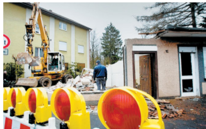
Weg wird frei gemacht: Der Rest des alten Pavillons an der Kreuzung Bismarckstraße/Nordring.

■ Bünde (ds). Bis vor einiger Zeit wurden hier noch Döner verkauft – gestern war der Abrissbagger im Einsatz und machte den Pavillon an der Kreuzung Nordring/Bismarckstraße dem Erdboden gleich.