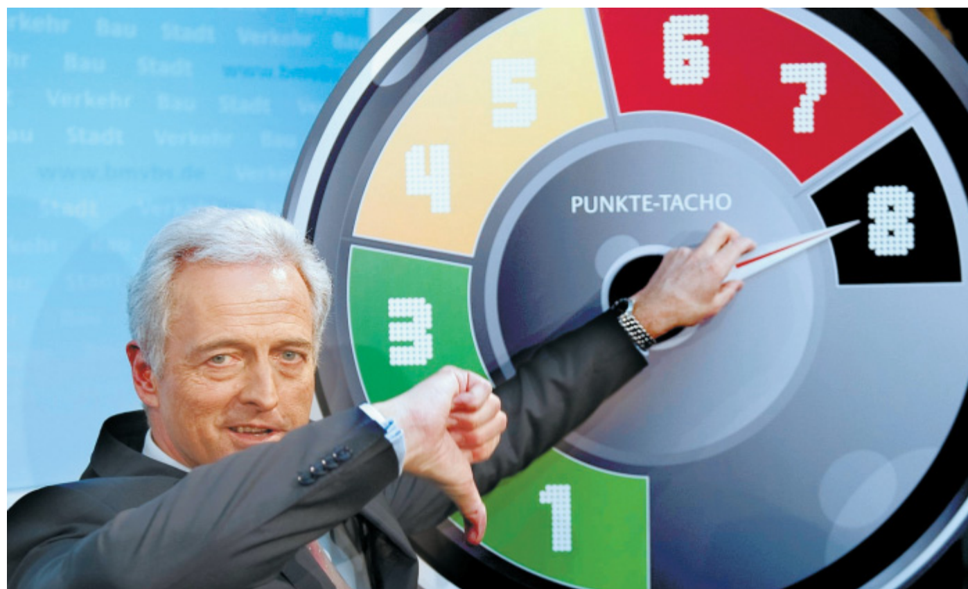
Acht Punkte - Lappen weg: Verkehrsminister Peter Ramsauer macht vor dem überdimensionierten Tacho deutlich, um was es geht.

Minister Ramsauer stellt Reform für Flensburger Verkehrsünderdatei vor